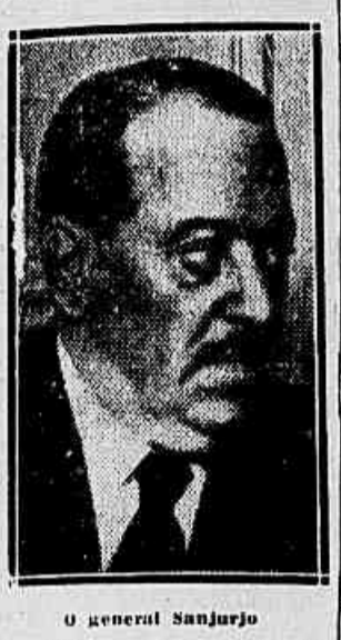
O general Sanjurjo

A política deve ser feita por políticos, diz o general Sanjurjo